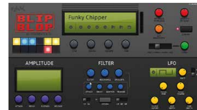
Geluiden uit het vroege homecomputer-tijdperk

deze samples van meer dan twintig jaar oud voor het grootste deel nog zeer bruikbaar zijn en nog lang niet het museum in hoeven. Misschien zijn de basissamples eenvoudiger dan de hoogwaardige sampling producten die je tegenwoordig koopt, maar de programmeurs van Roland hebben de vier layers altijd slim gebruikt om akoestische klanken te verpakken in een heerlijk padsausje, of ze al dan niet stereo te dubbelen, waardoor ze eigenlijk altijd aangenaam klinken en goed bespeelbaar zijn. Het enige minpunt van de synthesefuncties van de JV-engine was, en is, dat het filter bij hogere resonanties wat schril gaat klinken. Dit valt vooral op bij sommige klanken in SRX Dance Trax.