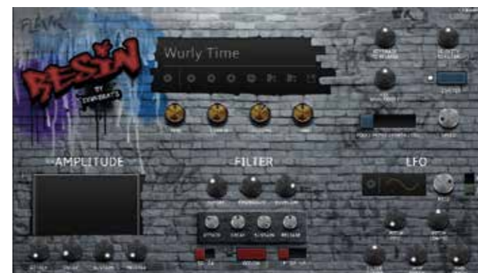
Een van de Concerto sample-libraries

De drumkits klinken warm en gedefinieerd