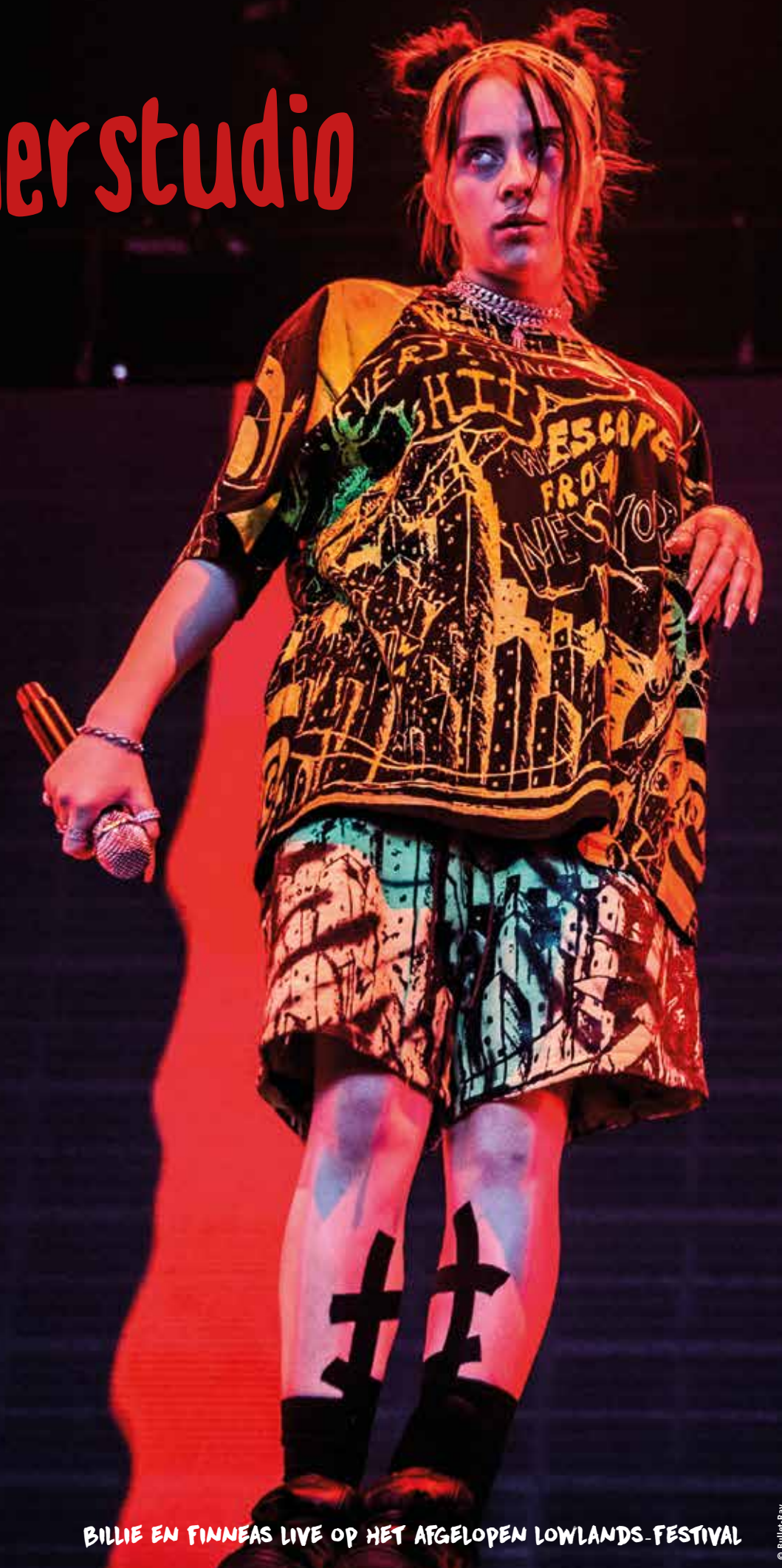
BILLIE EN FINNEAS LIVE OP HET AFGELOPEN LOWLANDS-FESTIVAL