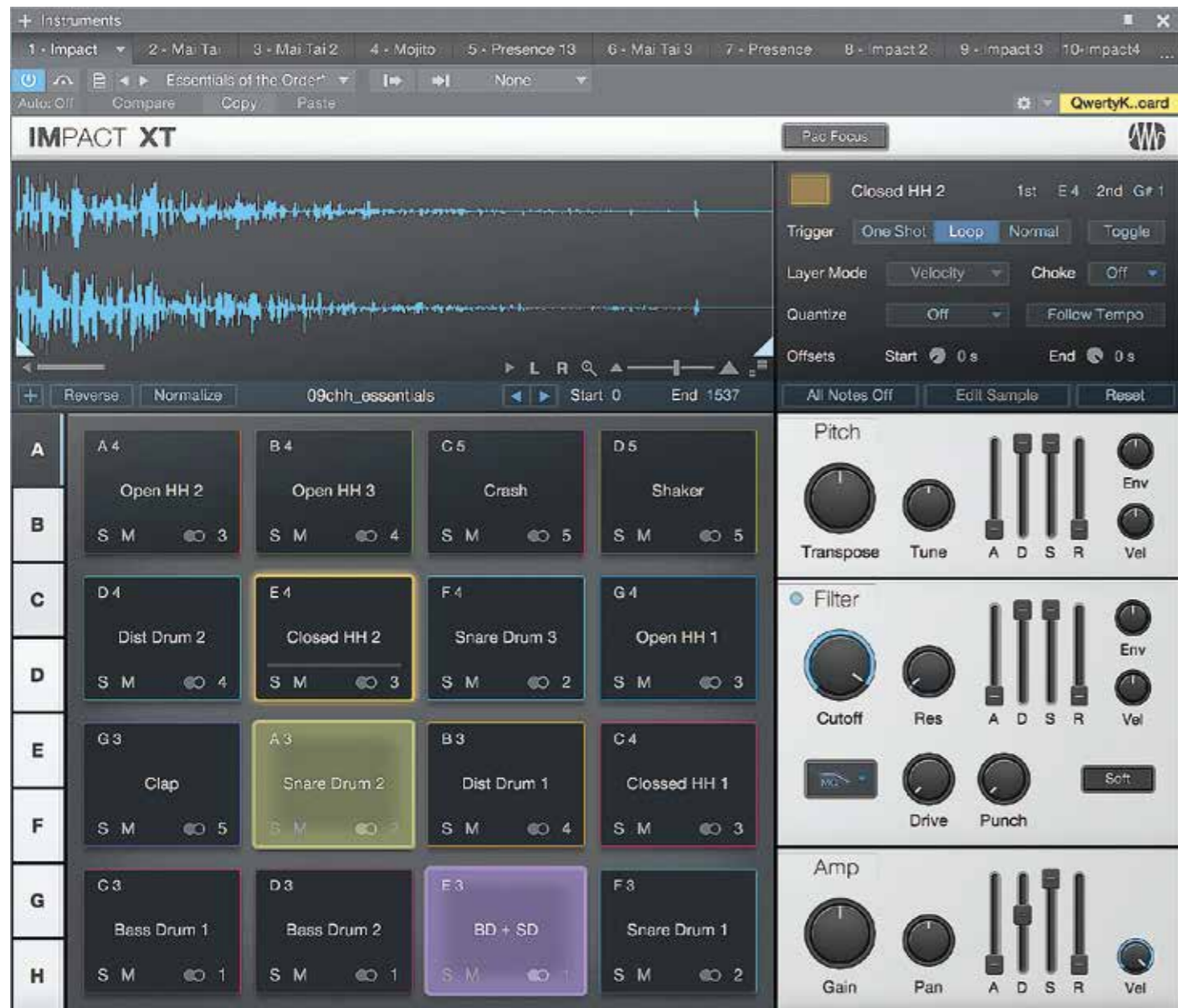
Impact XT beschikt nu over acht banken van zestien sounds verdeeld over pads, elk met een eigen kleur.