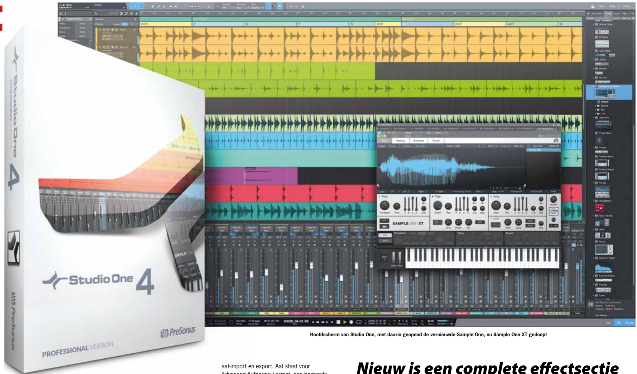
Hoofdscherm van Studio One, met daarin geopend de vernieuwde Sample One, nu Sample One XT gedoopt

aaf-import en export. Aaf staat voor Advanced Authoring Format, een bestands-protocol waarmee je projecten tussen daw's kunt uitwisselen. In Studio One werkt de import heel eenvoudig: je sleept de aaf-file op de arranger en het programma doet de rest. Indien nodig wordt om de locatie van de gekoppelde audiobestanden gevraagd. In de Professional-versie van Studio One kun je ook delen van bestaande Studio One songs importeren. Tijdens de import bepaal je in een keuzemenu welke kanalen/sporen je wilt invoegen. Deze worden vervolgens inclusief audio, midipart en plug-ins geïmporteerd.