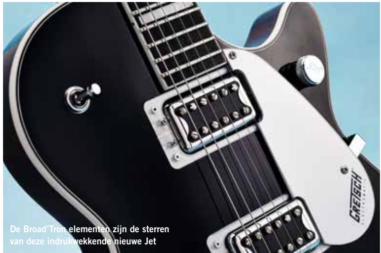
De Broad'Tron elementen zijn de sterren van deze indrukwekkende nieuwe Jet

De respons van de Broad'Trons zorgt voor indrukwekkende harmonische details als we de gitaar testen met een oversturende buizenversterker en met een Tube Screamer. De G5220 is inspirerend en aanslaggevoelig, perfect voor expressieve, violachtige leads met veel sustain. Wanneer we richting AC/DC en zelfs metal gaan, worden we pas echt verrast. Als het om een