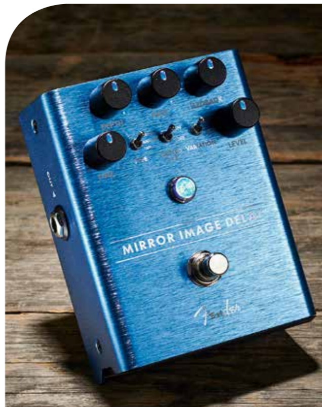
Mirror Image Delay

D e Mirror Image heeft drie soorten delay: digital, analog en tape. Van elke soort zijn er twee variaties. Je kunt delaytijd, feedback en level van de delay regelen, maar je kunt ook een modulatie-effect toevoegen waarvan je de diepte en snelheid kunt instellen. Zo krijg je een smaakvolle combinatie van delay en chorus. Verder kun je een extra delay van een gepunteerde achtste toevoegen aan de kwartnootdelay. De achtste krijgt ongeveer 75% van het volume van de kwartnoot, voor de sfeer van een multi-tap-delay en ritmische herhalingen. De belangrijkste digitale delay heeft een breed bereik van 20 tot 900 ms. Variatie 2 van de digitale delay heeft veel kortere delaytijden, voor een dubbel trackingeffect of een slapback-echo. De andere standen van het pedaal bieden imitaties van BBD- en tapedelays (maar zonder zelfoscillatie). De herhalingen zijn verre van perfect, zoals het hoort bij deze soorten delay. Variatie 2 van deze standen geeft een meer lofi-geluid.