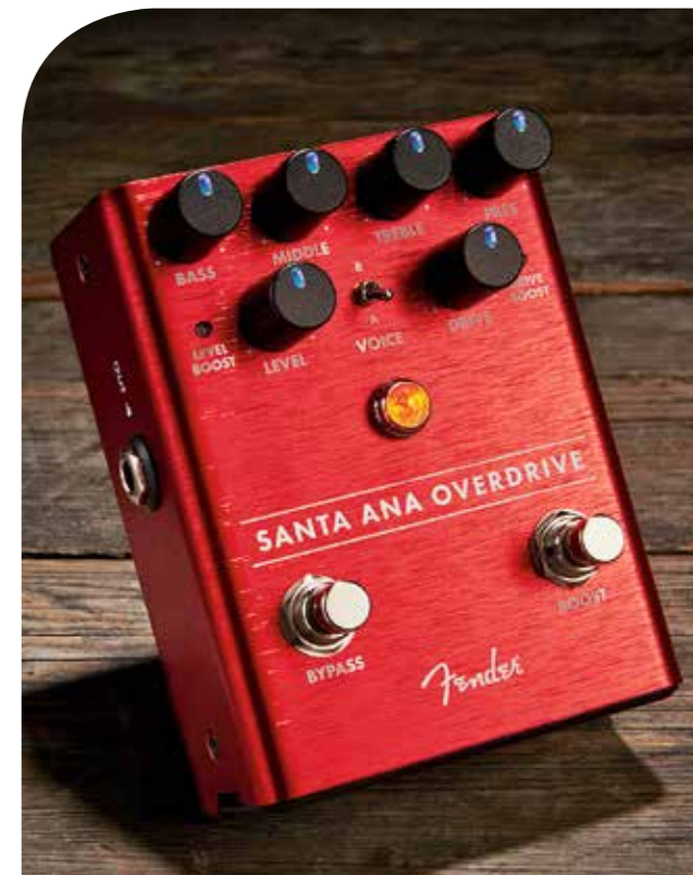
Santa Ana Overdrive

D e Santa Ana is een overdrivepedaal met twee voicings en een extra voet-schakelaar voor een boost. Hij maakt gebruik van een FET-circuit om de oversturing van een buizenversterker na te bootsen en dat doet hij heel goed. Het pedaal is aanslaggevoelig op een prettige manier en het geluid schoont mooi op als je de volumeknop van je gitaar verder dichtdraait. Er zijn veel verschillende sounds beschikbaar, van een clean-achtige boost tot de drive van een overstuurde versterker. Je kunt het geluid aanpassen met vier EQ-regelaars die aan het frontpaneel van een Fender versterker doen denken. De twee voicings zijn duidelijk Amerikaans en Brits. De Amerikaanse stand is helderder, met een scherp, bijna percussief gerinkel. De Britse sound is donkerder en past goed bij een versterker die van zichzelf heel helder is. Je kunt de Boost-schakelaar gebruiken om de overdrivetrap te boosten, voor een agressiever geluid met meer hoogmidden. Ook kun je ervoor kiezen het uitgangsvolume te vergroten. Deze optie boost net iets te veel naar onze smaak, maar er is helaas geen regelaar om de hoeveelheid boost in te stellen.