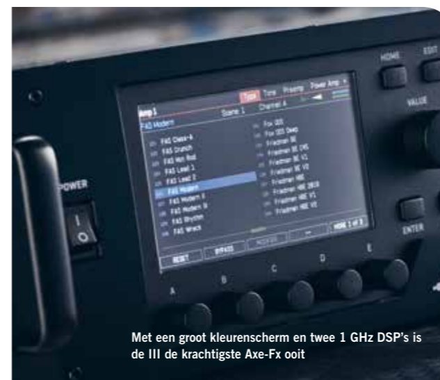
Met een groot kleurenscherm en twee 1 GHz DSP's is de III de krachtigste Axe-Fx ooit