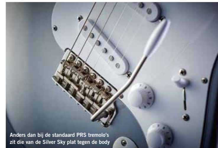
Anders dan bij de standaard PRS tremolo's zit die van de Silver Sky plat tegen de body

Het halsprofiel, de bespeelbaarheid, de intonatie en de stemvastheid zijn altijd van groot belang geweest bij PRS gitaren. Het hals-