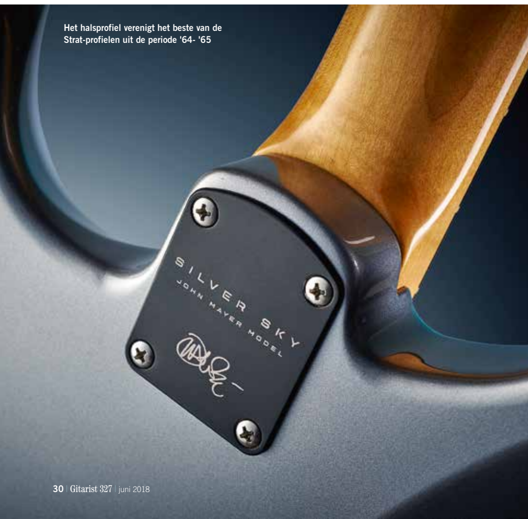
Het halsprofiel verenigt het beste van de Strat-profielen uit de periode '64- '65

PRS SILVER SKY PRIJS: € 2949,- (incl. gigbag) LAND VAN HERKOMST: VS TYPE: solidbody elektrische gitaar met dubbele cutaway BODY: elzen HALS: esdoorn, 635JM profiel, geschroefd MENSUUR: 648 mm (25,5 inch) TOPKAM/BREEDTE: been/42,35 mm TOETS: palissander, kleine vogelinleg, 184-mm (7,25-inch) radius FRETS: 22, klein HARDWARE: stalen blok-tremolo (PRS-ontwerp), vintagestijl lockingmechanieken (PRS-ontwerp), vernikkeld STRINGSPACING, BRUG: 53,5 mm ELEKTRONICA: 3 x PRS 635JM enkelspoelselement, vijfweg element-schakelaar, mastervolume, toon 1 (hals/midden) en toon 2 (brug) GEWICHT: 3,5 kg SERIE OPTIES: andere PRS gitaren met geschroefde hals zijn de CE 24 (€ 2699,-) en de DW CE 24 Floyd Ltd (€ 3210,-) LINKSHANDIG: nee KLEUREN: Onyx, Horizon, Tungsten (testexemplaar) en Frost body met natuurkleurige hals - hoogglans polyester/acryllak op de body; getinte hoogglans nitrocelluloselak op de hals DISTRIBUTIE: PRS Europe, Cambridge (VK), tel. +44 1223 874301 WEBSITE: www.prsguitarsusa.com