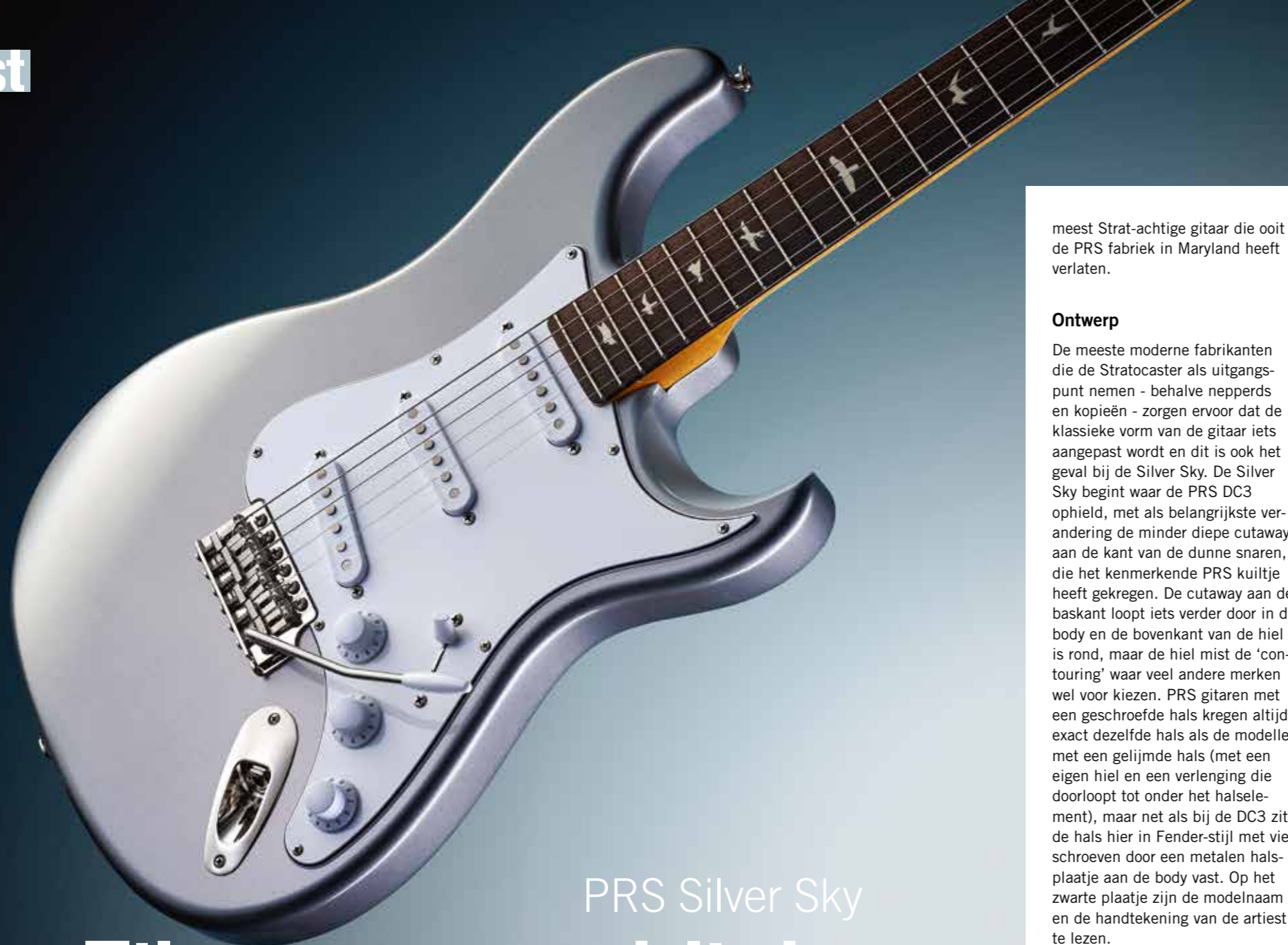
PRS Silver Sky