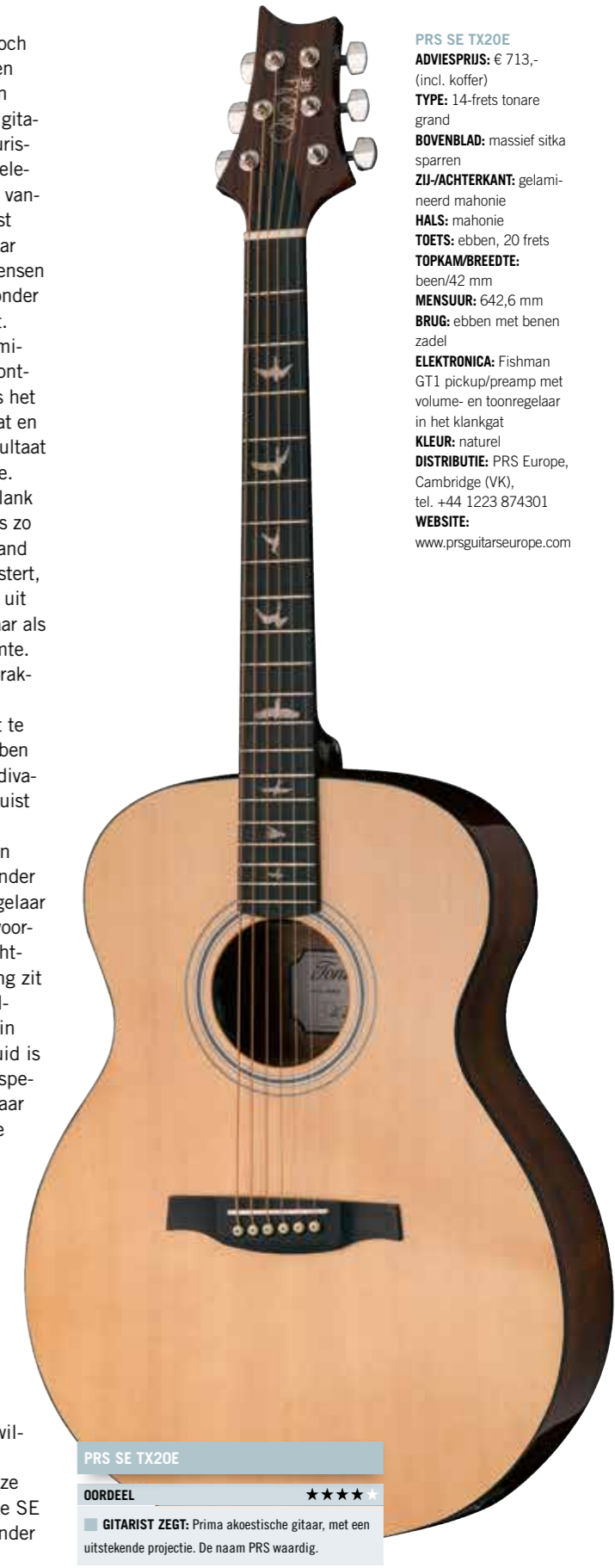
PRS SE TX20E

PRS SE TX20E ADVIESPRIJS: € 713,- (incl. koffer) TYPE: 14-frets tonare grand BOVENBLAD: massief sitka sparren ZIJ-/ACHTERKANT: gelamineerd mahonie HALS: mahonie TOETS: ebben, 20 frets TOPKAM/BREEDTE: been/42 mm MENSUUR: 642,6 mm BRUG: ebben met been zadel ELEKTRONICA: Fishman GT1 pickup/preamp met volume- en toonregelaar in het klankgat KLEUR: naturel DISTRIBUTIE: PRS Europe, Cambridge (VK), tel. +44 1223 874301 WEBSITE: www.prs-guitars-europe.com