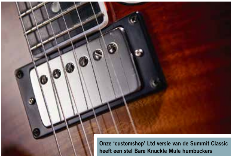
Onze 'customshop' Ltd versie van de Summit Classic heeft een stel Bare Knuckle Mule humbuckers