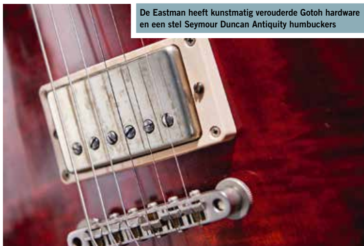
De Eastman heeft kunstmatig verouderde Gotoh hardware en een stel Seymour Duncan Antiquity humbuckers

Een ander modern onderdeel is de elektronica van de Summit Classic. De Bare Knuckle Mules zien er vrij klassiek uit, maar een klein, onopvallend drukknopje bij de onderste toonknop herbergt de actieve High-Definition Revoicer (HDR). Met het knopje "wordt het frequentiebereik van elk element opnieuw gevoicet en vergroot, waardoor je met één druk op de knop van passieve naar actieve elementen kunt overschakelen". De knoppen zijn eenvoudig van opzet, met een driewegschakelaar op de schouder, een enkele master volumeknop en een toonregelaar. De jackuitgang is van het ronde, verzonken soort dat we kennen van een Telecaster en de brug is een ResoMax van Graph Tech.