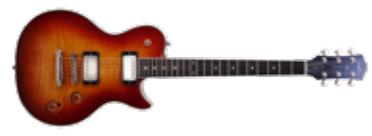
GODIN SUMMIT CLASSIC LTD

GITARIST ZEGT: De SB59/v heeft een klassieke constructie en handgebouwde uitstraling, met een verouderde, vintage-achtige singlecut-feel en dito klanken