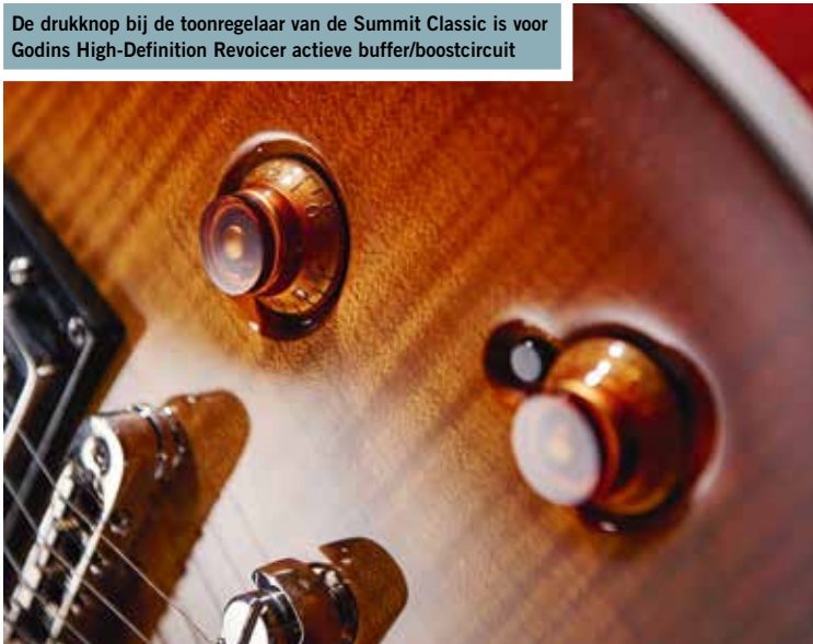
De drukknop bij de toonregelaar van de Summit Classic is voor Godins High-Definition Revoicer actieve buffer/boostcircuit

bij de hiel is de hals voller en ronder geworden. Hij is niet ideaal voor gitaristen die graag over de hele lengte een dunne hals hebben. Het verbaast ons niet dat de hals van de modernere Godin ook zeer welgevormd is. De schouders zijn iets slanker, maar toch voelt de hals minder dik aan terwijl hij over de