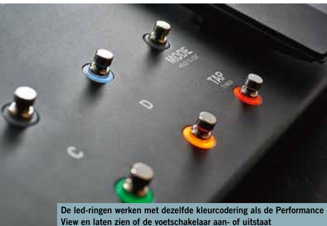
De led-ringen werken met dezelfde kleurcodering als de Performance View en laten zien of de voetschakelaar aan- of uitstaat

Oké, de LT heeft niet alle functies van zijn grotere en duurdere broer, maar hij heeft nog steeds precies hetzelfde geluid en dezelfde eenvoudige bediening. Zo kun je geluiden snel en intuïtief aanpassen vanaf het regelpaneel of met de software-editor op je computer. Zou je die ontbrekende functies van de originele Helix gaan missen? Voor de meeste gitaristen geldt: waarschijnlijk niet. Er is nauwelijks iets verloren gegaan waardoor de LT minder geschikt zou worden voor livegebruik, tenzij je echt niet