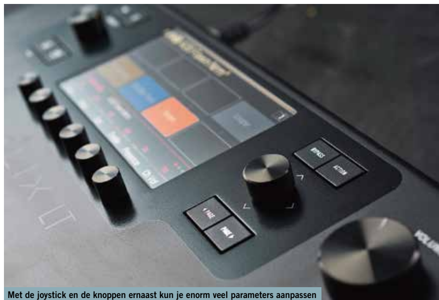
Met de joystick en de knoppen ernaast kun je enorm veel parameters aanpassen

zonder die twee extra send/returns en dat derde expressiepedaal kunt.