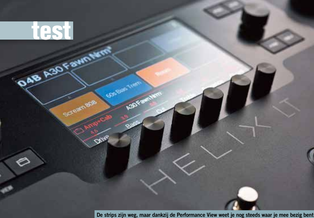
De strips zijn weg, maar dankzij de Performance View weet je nog steeds waar je mee bezig bent

>> verschillende manieren gebruiken, want de 1024 presets hebben vier stereo signaalpaden met diverse routingmogelijkheden. Zo kun je maar liefst 32 effectblokken gebruiken. En als je bekend bent met de Helix, dan weet je dat de kwaliteit van de geluiden en de hoeveelheid klanken waaruit je kunt kiezen enorm indrukwekkend zijn.