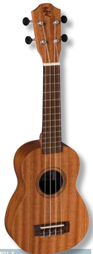
BATON ROUGE UR21-S SOPRAAN-UKULELE EN UR21-C CONCERT-UKULELE