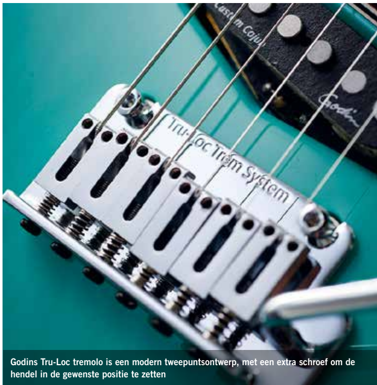
Godins Tru-Loc tremolo is een modern tweepuntsontwerp, met een extra schroef om de hendel in de gewenste positie te zetten

20,3 mm diep, bij de twaalfde fret 22,6. Geen customshop, maar toch allesbehalve standaard - en dat is meteen een goede omschrijving van de gehele Session Custom '59.