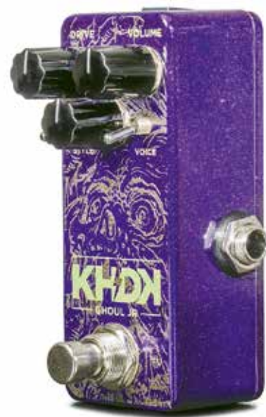
KHDK GHOUL JR