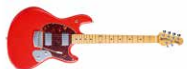
MUSIC MAN STINGRAY

GITARIST ZEGT: Gitaar met een goede constructie, geluid en bespeelbaarheid, met als bonus het Silent Circuit en de gebufferde output. En met standaard afmetingen!