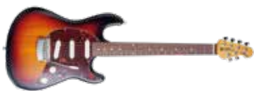
MUSIC MAN CUTLASS

dan wel laten inspireren door zijn eigen vroegere modellen, maar dit zijn fantastisch gebouwde moderne gitaren die spelen als een droom. Het ruisonderdrukkende Silent Circuit en de transparante buffer zorgen ervoor dat er geen enkel probleem is met gebrom of een verlies van helderheid bij lange kabels. De StingRay komt verrassend uit de hoek. Laat je niet foppen door zijn retro-uiterlijk: deze gitaar kan vrijwel elke stijl aan die je kunt bedenken. Modern? Ja. Klassiek? Beide gitaren verdienen het om klassiekers te worden. Bestel ze nu! 📧