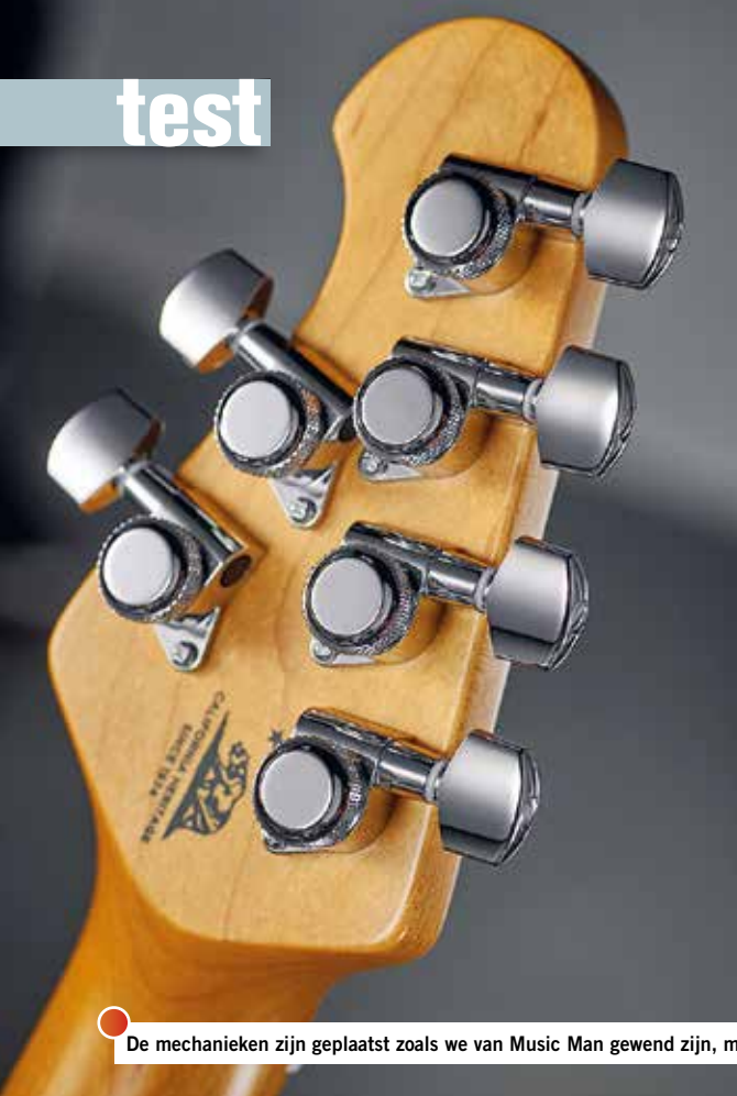
De mechanieken zijn geplaatst zoals we van Music Man gewend zijn, maar de kop van deze gitaren is langer