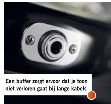
Een buffer zorgt ervoor dat je toon niet verloren gaat bij lange kabels

De StingRay is ook piekfijn uitgevoerd. Hij doet met zijn Fenderachtige silhouet, vergelijkbare uitsparingen en dezelfde radius aan de randen als de Cutlass absoluut denken aan die originele gitaren. De body van Afrikaans mahonie heeft grote invloed op het uiteindelijke geluid en het grotere gewicht van de gitaar. De meeste kenmerken zijn hetzelfde als bij de Cutlass, maar het is geen verrassing dat dit model is uitgerust met twee Music Man humbuckers met kapjes. Het verchromde regelpaneel met de