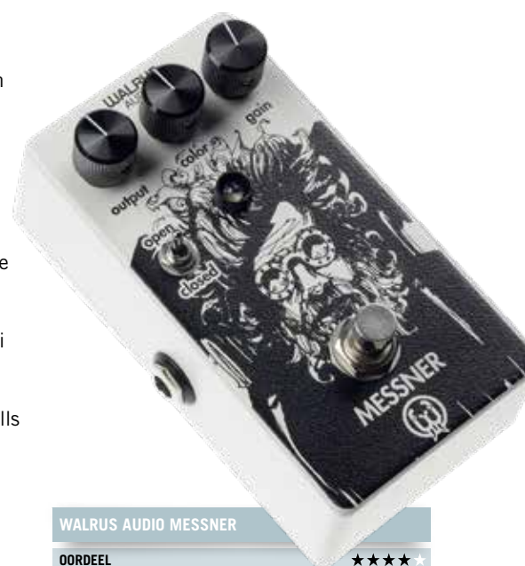
WALRUS AUDIO MESSNER