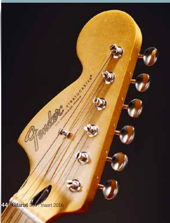
De grote Strat-kop van na '65 ziet er omgedraaid cool uit, vooral met het sixties-stijl Fender-logo aan de goede kant

GITARIST ZEGT: Cool uitzijnde gitaar met een echte Jimi-uitstraling, speelt en klinkt te gek, wel slechts rechtshandig verkrijgbaar.