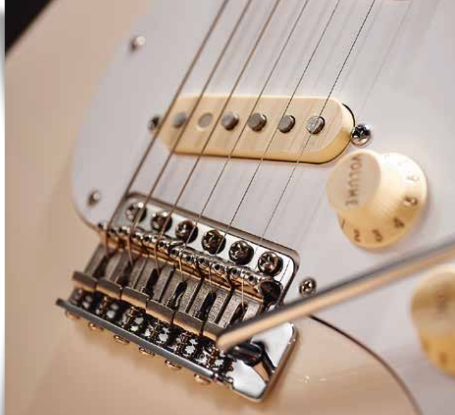
De omgekeerde hoek van het brugelement geeft diepte aan de hoge en meer twang aan de lagere snaren. Verrassend genoeg ziet het er best normaal uit

Als je Hendrix wel eens hebt zien spelen, is het je vast opgevallen dat hij op zijn omgekeerde Strat weinig toegang had tot de hoogste frets. Hij speelde zelfs nauwelijks op dat stoffige gedeelte van de hals. Met de rechtshandige body van onze gitaar is dat in één keer opgelost. Het ondiepe C-profiel van de hals ligt heel prettig in de hand en ook de medium jumbofrets op de toets met een plattere radius van 241 mm (9,5 inch) zorgen voor een geweldige speelervaring. De actie van onze gitaar was te laag voor een stevige aanslag zoals die van Jimi. De bovenste snaar liep bijna van de toets af bij flinke bends, maar door de brugzadels van de eerste en