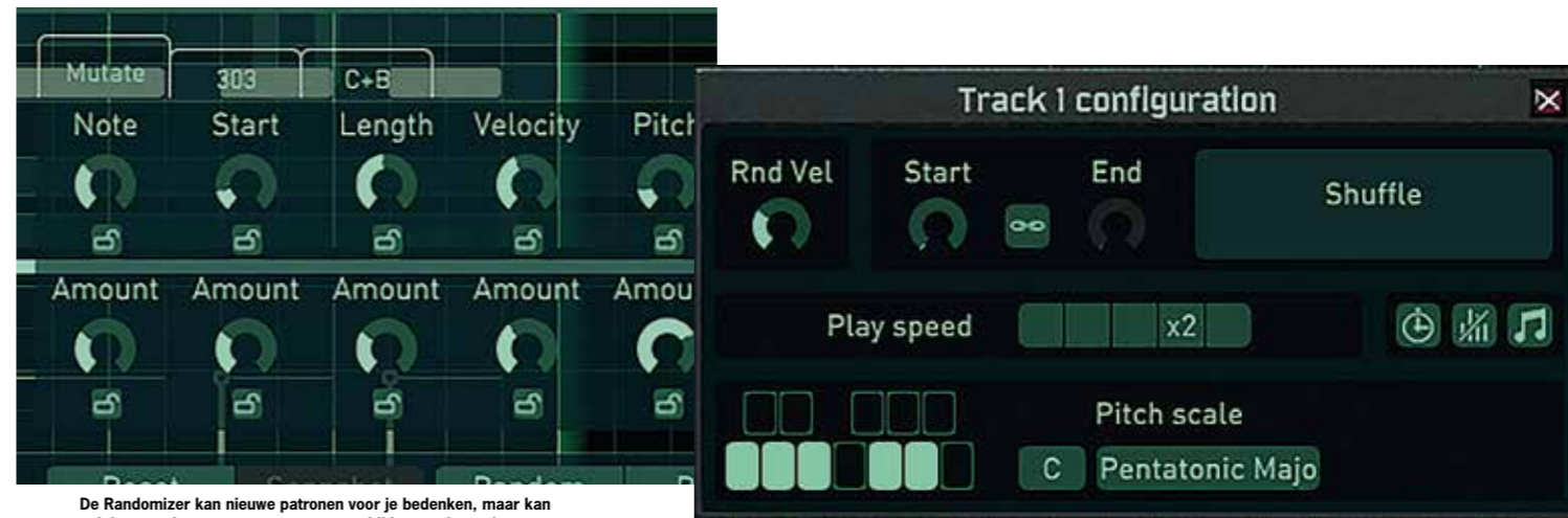
De Randomizer kan nieuwe patronen voor je bedenken, maar kan ook bestaande patronen muteren voor altijd weer nieuwe input.