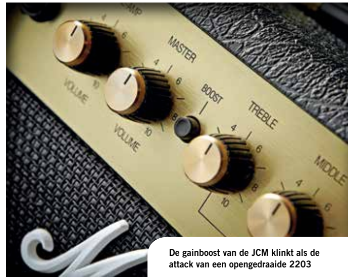
De gainboost van de JCM klinkt als de attack van een opengedraaide 2203

In de vroege jaren '80 ontstond een nieuwe geluidsmijlpaal: de JCM800 serie. De eerste versterkers met een mastervolumeregelaar bestonden al rond 1975. In de vier, vijf jaar die daarop volgden introduceerde Marshall een aantal veranderingen in het uiterlijk, die in 1981 werden bezegeld met een bedieningspaneel dat zich over de hele breedte van de JCM800 uitstrekte. In dat jaar kwam er ook een einde aan de Rose-Morris distributieregeling, die er effectief voor gezorgd had dat Marshall vijftien jaar lang zijn producten niet aan de andere kant van de oceaan kon verkopen. De eerste JCM800's waren in feite niet meer dan Master Volume modellen in een nieuwe verpakking, maar ongeveer een jaar later werd de serie uitgebreid met versies waarvan de kanalen met een voetschakelaar konden worden bediend en die effectloos en veergalm in huis hadden. Het cleane kanaal van de vroegste JCM800's was niet geweldig, laten we eerlijk zijn. Het allesverwoestende leadkanaal werd echter direct populair bij de rock- en heavy metal-