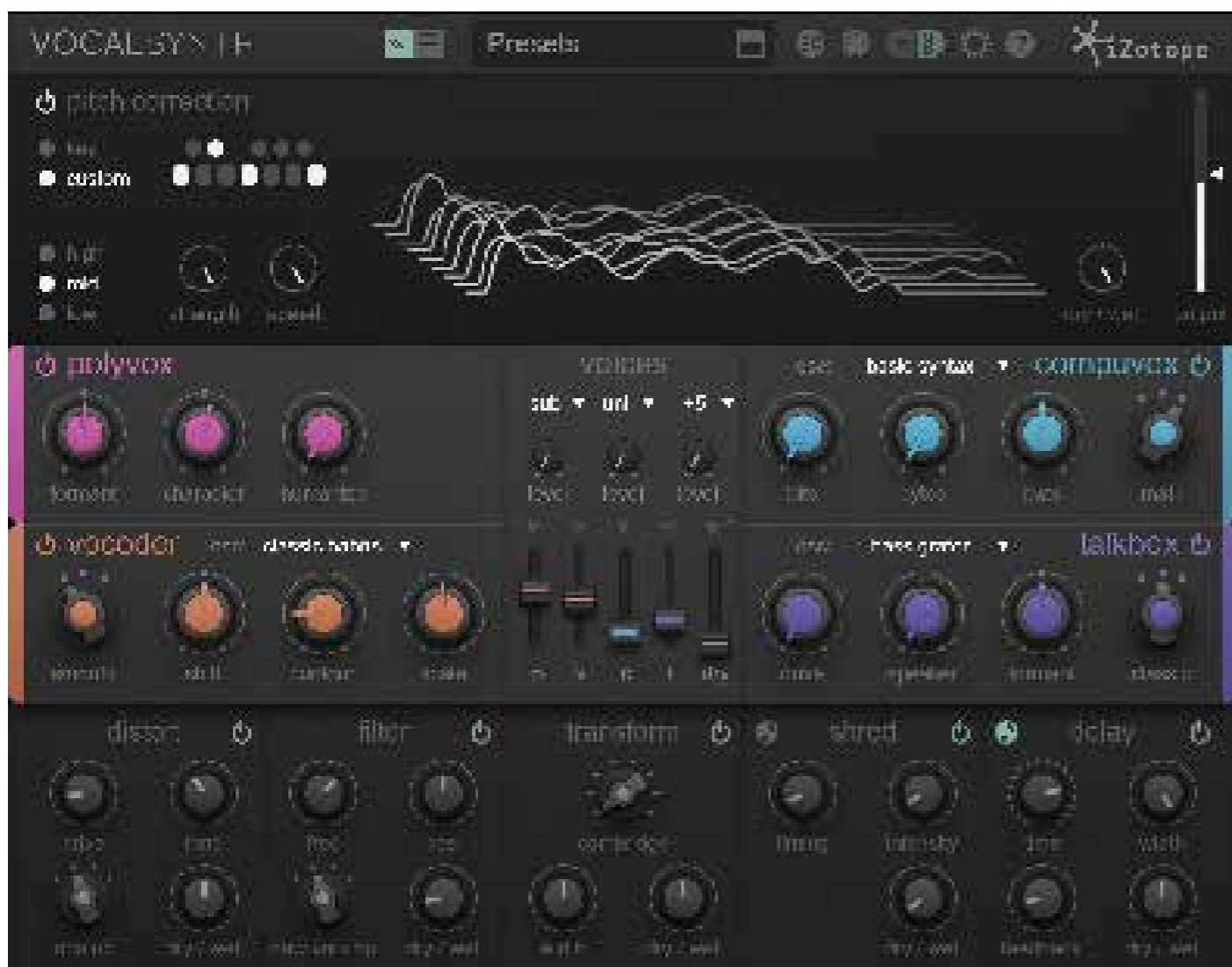
In de Vocoder heb je keuze uit tien verschillende golfvormen.