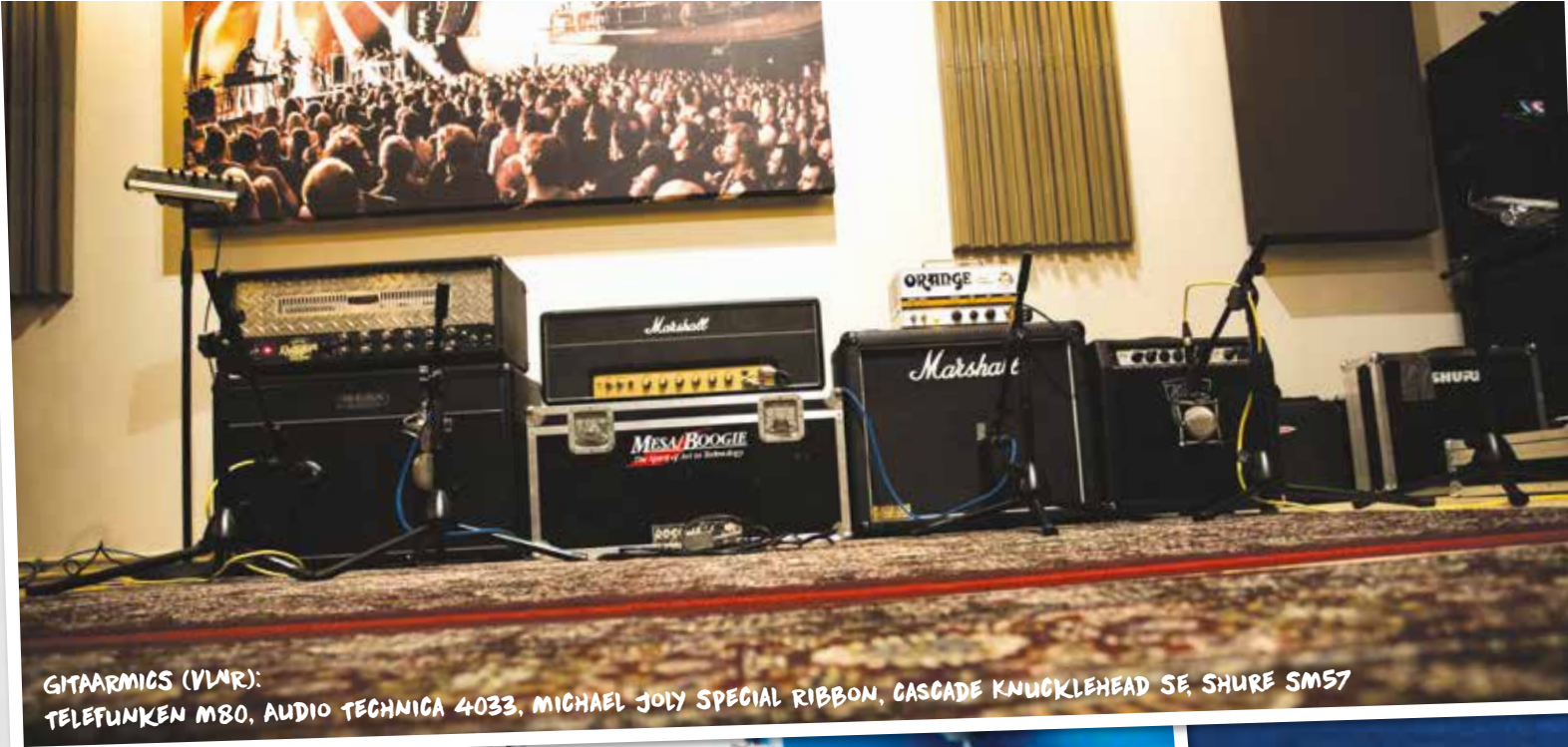
GITAARMIGS (VLMR): TELEFUNKEN M80, AUDIO TECHNICA 4033, MICHAEL JOLY SPECIAL RIBBON, CASCADE KNUCKLEHEAD SE SHURE SM57