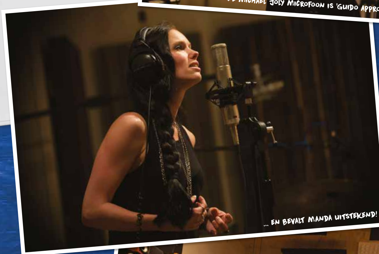
... EN BEVALT MANDA UITSTEKEND!