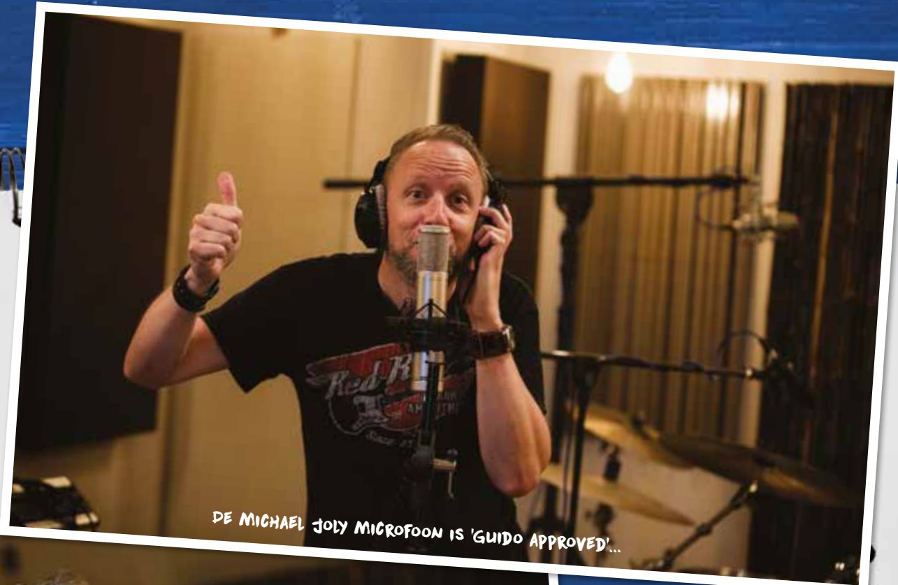
DE MICHAEL JOLY MICROFOON IS 'GUIDO APPROVED'...

MICROFOON: CUSTOM MICHAEL JOLY-BUIZENMICROFOON PREAMP: VINTAGE JOE MEEK VOICE CHANNEL VC1 'THE BRICK' HOOFDTELEFOON: BEYERDYNAMIC DT 770 PRO