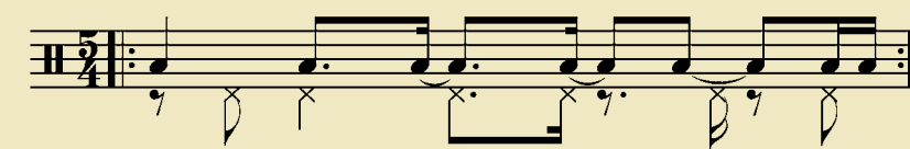
Ritme van de baslijn met clave in de linkervoet