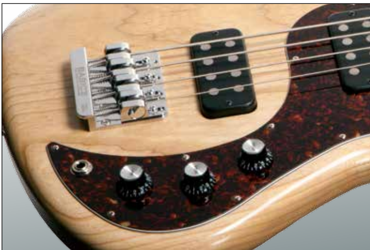
Beide humbuckers kunnen gesplitst worden met de push/pull-volumeknoppen

WE VONDEN NIET GOED Op den duur helemaal niets