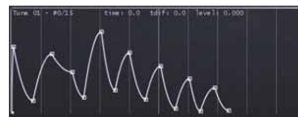
Je kunt envelopes helemaal vrij configureren met verschillende curves en vormen.