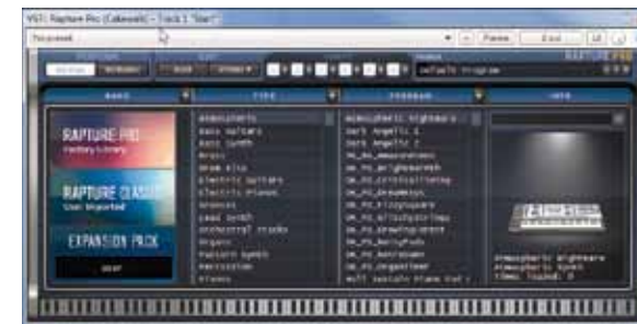
De browser met een overzicht van alle programma's