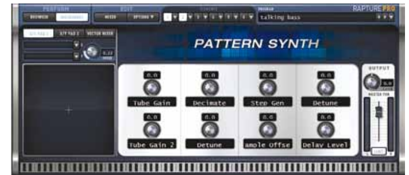
Met de Macro-knoppen kun je veel gebruikte parameters direct besturen. Jammer genoeg zijn ze niet voor alle programma's geprogrammeerd, maar dat kun je zelf doen in de modulatiematrix.