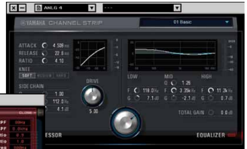
Met de grote knop op de channelstrip morph je door een aantal bruikbare presetinstellingen.