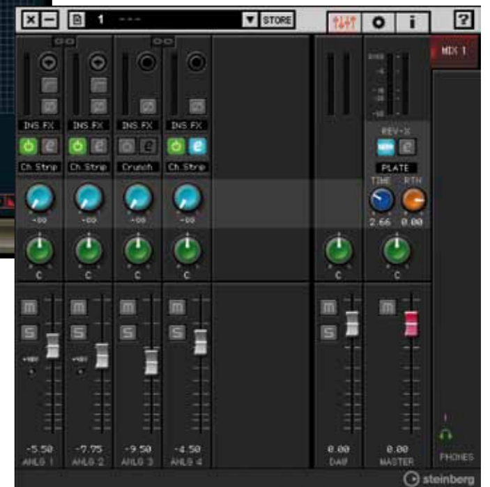
Met de mixersoftware van Yamaha stuur je alle functies en dsp-effecten in de UR242 aan.