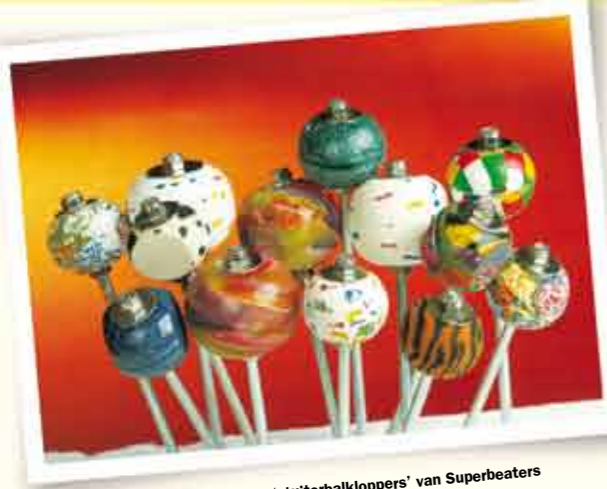
De flitsende rubberen 'stuiterbalkklopers' van Superbeaters

Pas wel op: de vorm, het gewicht en het materiaal van de bassdrumklopper zijn ook van invloed op je spelgevoel. De ideale bassdrumklopper is er dus een die niet alleen klinkt zoals je wilt, maar ook zo speelt. (Dennis Boxem)