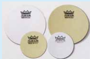
Remo Falam Slam bassdrumpatches

Bij veel bassdrumvellen krijg je tegenwoordig een gewezen kevlar of kunststof sticker, die je op het vel kunt plakken. Deze sticker zorgt er niet alleen voor dat het vel beter beschermd wordt voor de aanslag van de klopper, het geeft je sound ook wat meer tik. Bedenk voor je de sticker aanbrengt of je die extra tik in je geluid wilt hebben. De meeste stickers hebben een behoorlijk sterk klevende lijmlaag die niet makkelijk te verwijderen is. De stickers zijn ook los te verkrijgen in verschillende afmetingen en diktes, die allemaal hun eigen invloed op de duurzaamheid en het geluid hebben. Hoe dunner de sticker, hoe minder de invloed op de klank. Een hardere kunststof sticker geeft de klank meer tik dan een bijvoorbeeld gewe-