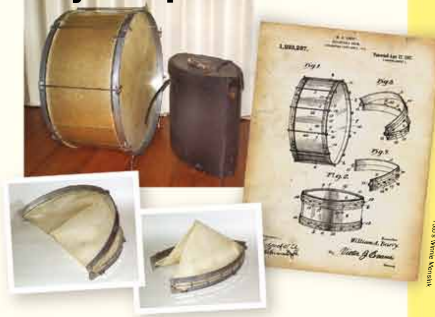
In 1917 was een normale bassdrum 28"x14", en een hele last voor de drummer en zijn omgeving. W.A. Barry vond daar wat op en patenteerde dat jaar de opvouwbare bassdrum (zie patentdocument). Het slimste aan zijn uitvinding waren de aluminium hoopels, die twee maal scharnierden. De vellen bleven aan de hoopels vastzitten en vouwden dus ook op. De ketel zelf had vier pianoscharnieren, waardoor het gevaarte paste in een koffer ter grootte van een fikse snare. De bassdrum op de foto (ongeveer 1926) heeft een houten ketel met zilveren glitterbekleding, en heeft een doorsnee van 27 inch. Met een kussentje erin geeft hij een vette vintage boem. (Winnie Mensink)