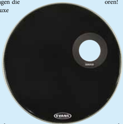
Voorvel met gat

Sta open voor suggesties en ga af op je oren!