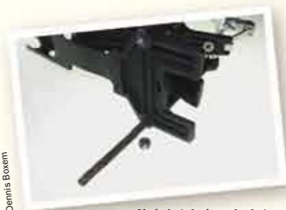
Als je het dopje onder het frame verwijderd, komen de drukveren makkelijk uit hun post naar buiten.

Geliefd en verguisd, de Speed King heeft een aantal ontwerpfeatures die heden ten dage nog steeds als modern gezien kunnen worden. Dacht je dat een direct drive -overbrenging tussen as en voetblad iets nieuws was? Of een voetblad zonder hielstuk? Een bodemplaat in plaats van de metalen vork om voetblad en frame aan elkaar te verbinden dan? De Speed King had al deze features al in 1937. En dan hebben we het nog niet eens over het kenmerk dat niet alleen zorgt voor het soepele en karakteristieke spelgevoel, maar tevens de Squeak King zijn koosnaampje heeft bezorgd. Want piepen kunnen ze, de in het frame verborgen