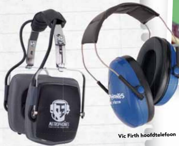
Vic Firth hoofdtelefoon