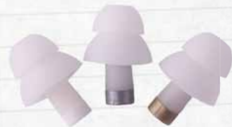
Alpine MusicSafe Pro universele oordoppen

De genoemde merken zijn slechts bedoeld als voorbeelden. Let wel, de meeste bieden meerdere soorten gehoorbescherming. Zo heeft Exinore ook universele oordoppen en maken Alpine en Earsonics ook otoplastieken op maat.