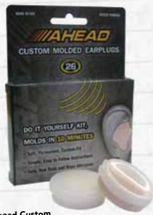
Ahead Custom Molded Earplugs