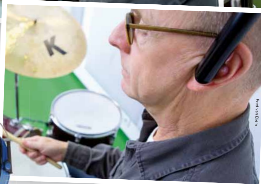
Jeltes met Zem hoofdtelefoon