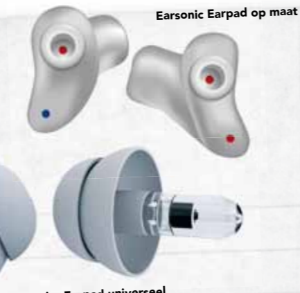
Earsonic Earpad op maat