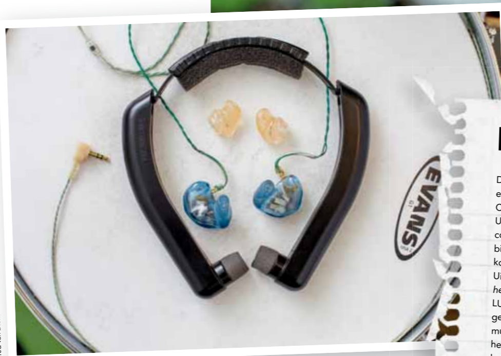
Fred van Dierm

m'n trommelvlies. Heel lastig ja, Maar met watjes in de oren ging het wel.' Maar het ging van kwaad tot erger. Het ruisje na het optreden werd een piepje. Eerst links, later ook in het rechteroor. Het duurde ook steeds langer voordat de piep weer verdween. 'Toen ben ik er wel wat rekening mee gaan houden. Iets rustiger spelen, niet meer repeteren met de muziek >>