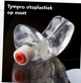
Tympro otoplastiek op maat

Een wat vreemde eend in de bijt vormen de Ahead Custom Molded Earplugs; een tweecomponentenpasta waarmee je zelf