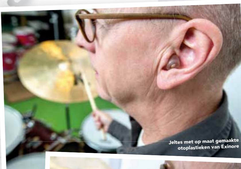
Jeltes met op maat gemaakte otoplastieken van Exinore