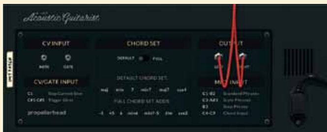
Achterop A-list Acoustic Guitar kies je voor de uitgebreide of standaard akkoordenset, die minder werkgeheugen nodig heeft.

Reason heeft er met de update naar versie 8 geen nieuwe muziekinstrumenten bij gekregen. Wel heeft Propellerhead onlangs nieuwe instrumenten ontwikkeld die je in de Rack Extension Shop kunt aanschaffen. We bekijken er twee.