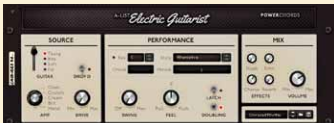
Een geduldige sessiegitarist die alle powerchords speelt die je nodig hebt en nooit zeurt.

Bij het kiezen van de juiste akkoorden assisteert A-List Acoustic Guitarist je. Als je de juiste toonsoort (toonladder) kiest van het stuk waarin je werkt, helpt het programma je al een eind op weg met de akkoorden. Het is echter geen automatische compositietool. Je moet zelf de akkoordenschema's maken en besturen.