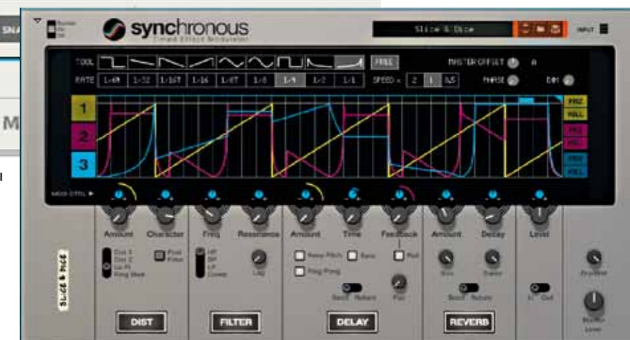
Synchronous is een goed voorbeeld van de nieuwe grafische mogelijkheden van de Reason gebruikersinterface.

De browser is het nieuwe creatieve centrum van Reason geworden