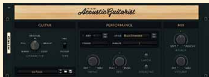
A-list Acoustic Guitar kan dertien verschillende akkoorden in diverse realistische slagstijlen produceren.

In de Performance-sectie kies je de stijl en het patroon binnen de stijl, maar dit kan ook met de toetsen op je controller. Daarnaast kun je de mate van swing instellen, maar ook de timing luier of juist puntiger maken. Meer vóór of ná de tel spelen dus. De Doubling-knop is ook erg handig. Powerchords worden bijna altijd meerdere keren ingespeeld, waarbij de verschillende takes in het stereobeeld worden verdeeld om een vettere sound te krijgen. Met Doubling doet A-List Electric Guitarist dit automatisch voor je, zodat je meteen al twee partijen hebt. Natuurlijk mogen passende effecten ook niet ontbreken, en die vind je in de laatste sectie op het bedieningspaneel. Slapback (korte echo), langere echo, chorus en reverb kun je tegelijk en traploos toevoegen.