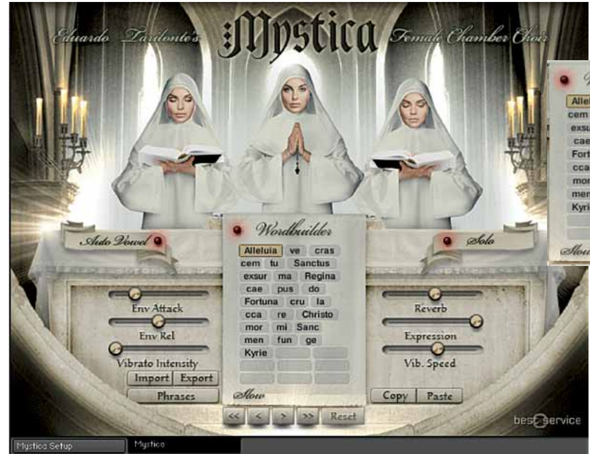
In de Word Builder kun je eigen zinnen en lettergrepen combineren.

tonen van een langer woord automatisch de juiste klinker laten volgen. Na do komt automatisch o-o-o en als je na re legato blijft doorspelen volgt e-e.