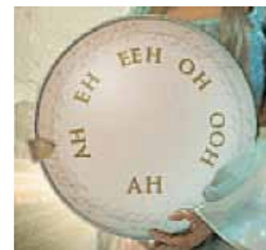
Met het Vowel Wheel kun je klinkers morphen met de muis in de grafische interface, of vanaf het klavier met key switches.

Een solostem zonder vibrato die toch warm klinkt, is niet iedereen gegeven