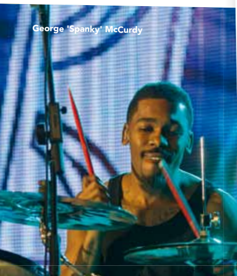
George 'Spanky' McCurdy

Bekijk ook het artikel op Slagwerkkrant.nl over de Tama 40th Anniversary Party, met een flink aantal video's die we daar konden maken. Van bijvoorbeeld dé verrassing van dit festival, Matthew Garstka met Animals As Leaders, en verder nog Simon Phillips met Protocol, Billy Cobham met Dean Brown, Charlie Benante met Anthrax, Lenny White, Mike Portnoy en nog veel meer.