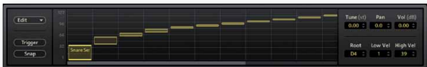
Een cel in Battery kan meerder sample-layers bevatten voor een genuanceerde en dynamische klank.

wijze verschillende velocity-waarden moeten opleveren, zoals bij vrijwel alle andere drumsamplers, maar dat is bij Battery nog niet het geval. Ook blijft het jammer dat je veel heen en weer moet klikken tussen de verschillende tabbladen om een klank vorm te geven. Dat is vermoeiend, zeker als je uitgebreide kits samenstelt. Jammer is ook dat de complete cell library niet meer als losse cellen wordt bijgeleverd, zoals bij Battery 3. Een alternatieve manier om afzonderlijke cellen uit de preset kits te combineren, is twee instanties van Battery 4 als plug-in openen in je daw, en cellen kopiëren en plakken in een nieuwe kit. Dat werkt redelijk snel en overzichtelijk.