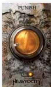
Met één knop eigen rechter spelen in Damage

>> De geluiden voor Damage zijn speciaal voor deze library opgenomen en zitten dus niet in de andere Heavyocity libraries in Komplete 9 Ultimate. Damage gebruikt diverse geluidsbronnen: van auto's en machines die tot pulp worden geslagen met mokers, ongezond stroeflopende machinerie tot aan ontplofende voertuigen toe. Maar ook veel traditionele percussie en drums met veel impact en een flinke rauwe rand als dat nodig is. Kicks, snares, hihats en bekkens, pauken, octabans en plastic percussie. En wat dacht je van met een strijkstok bespeeld schroot of een springdrum door een turbogalmveer? Ook met de loops zijn construction kits gemaakt, zodat je elke keer een passende set krijgt. In totaal zijn er 58 kits die terugrijpen op 200 klankbronnen, die ook beschikbaar zijn als meer dan 500 afzonderlijke hits en shots.