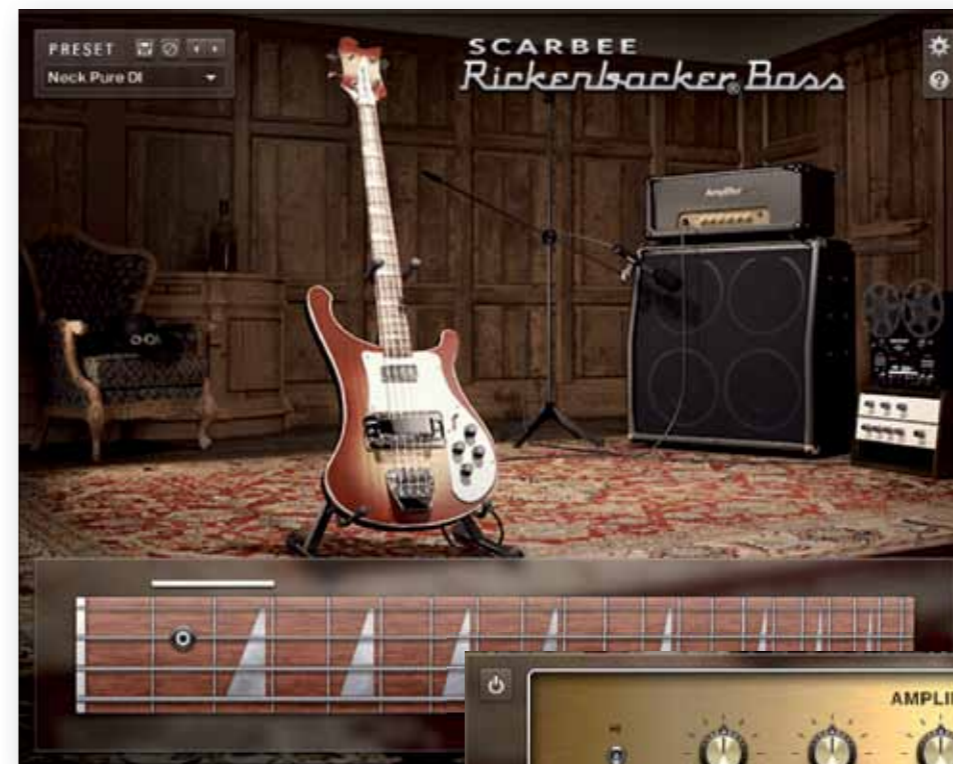
Naast de gesampled bas heeft Rickenbacker bass ook een amp, cabinet en effectketen met compressie, tapesimulatie en vierbands eq.

met Pharrell Williams en Nile Rogers bewijst dat deze stijl eigenlijk nooit verdwijnt.