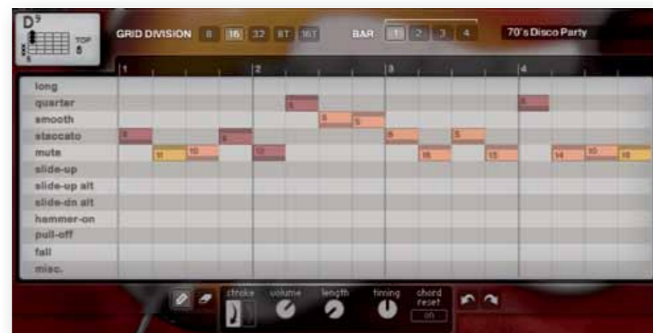
De patterns in Scarbee Funk Guitarist kunnen verregaand worden aangepast. Er zijn diverse articulaties gesampled.

Een onmisbaar onderdeel van Komplete is Reaktor, de modulaire omgeving om synthesizers en effecten mee te bouwen. Deze heeft in de loop der jaren al vele fantastische apparaten opgeleverd, en een groot deel