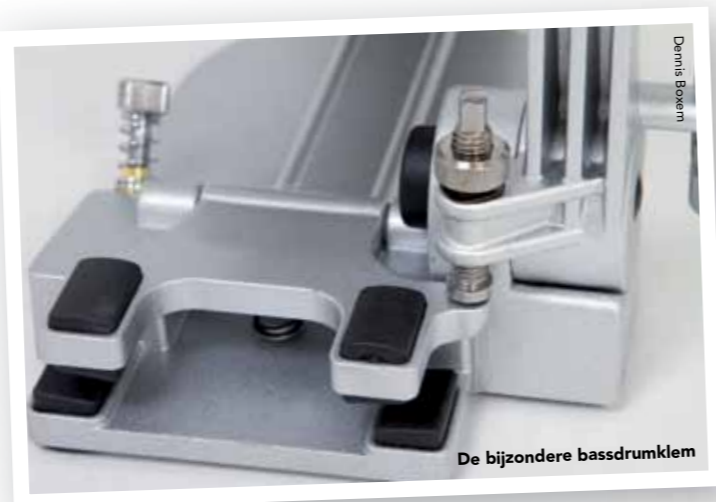
De bijzondere bassdrumklem