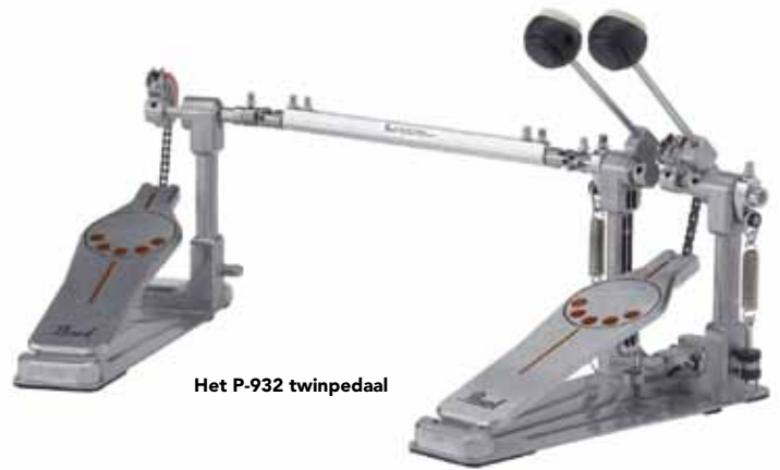
Het P-932 twinpedaal

De 800-serie is de hardwarereeks die bij bijvoorbeeld de Export en de goedkoopste Vision drumkits wordt geleverd. Alle standaards zijn dubbelbenig, maar zeker niet te zwaar. De bekkenstandaards bestaan uit drie delen in plaats van twee, zodat de hoogte net zo ruim verstelbaar is als bij de duurdere series. De bekkenstandaards zijn behoorlijk stevig, maar minder geschikt om er naast je bekkens nog van alles aan vast te klemmen. Een stevige ride houdt zo'n standaard prima, maar een