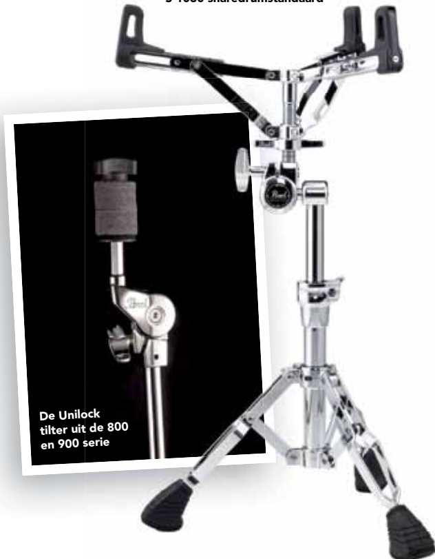
De Unilock tilter uit de 800 en 900 serie