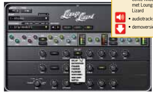
De effectsectie van Lounge Lizard 4 is behoorlijk uitgebreid.