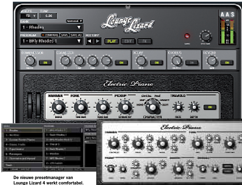
De nieuwe presetmanager van Lounge Lizard 4 werkt comfortabel.