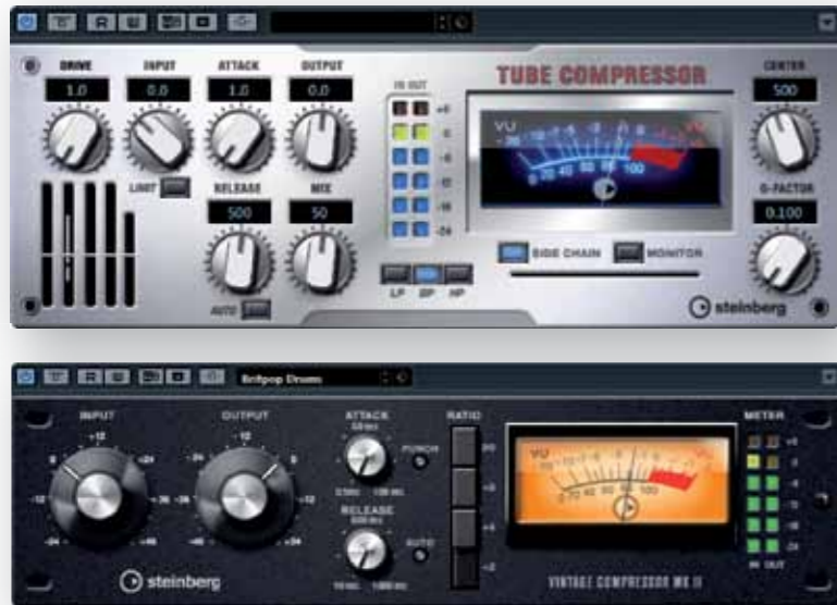
Tube Compressor en Vintage Compressor