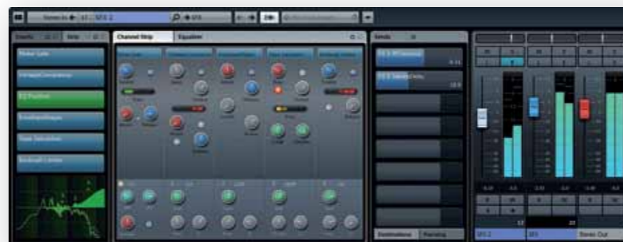
Channel Settings window