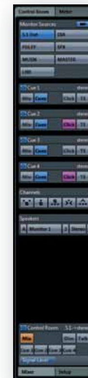
Control Room & Cue Sends