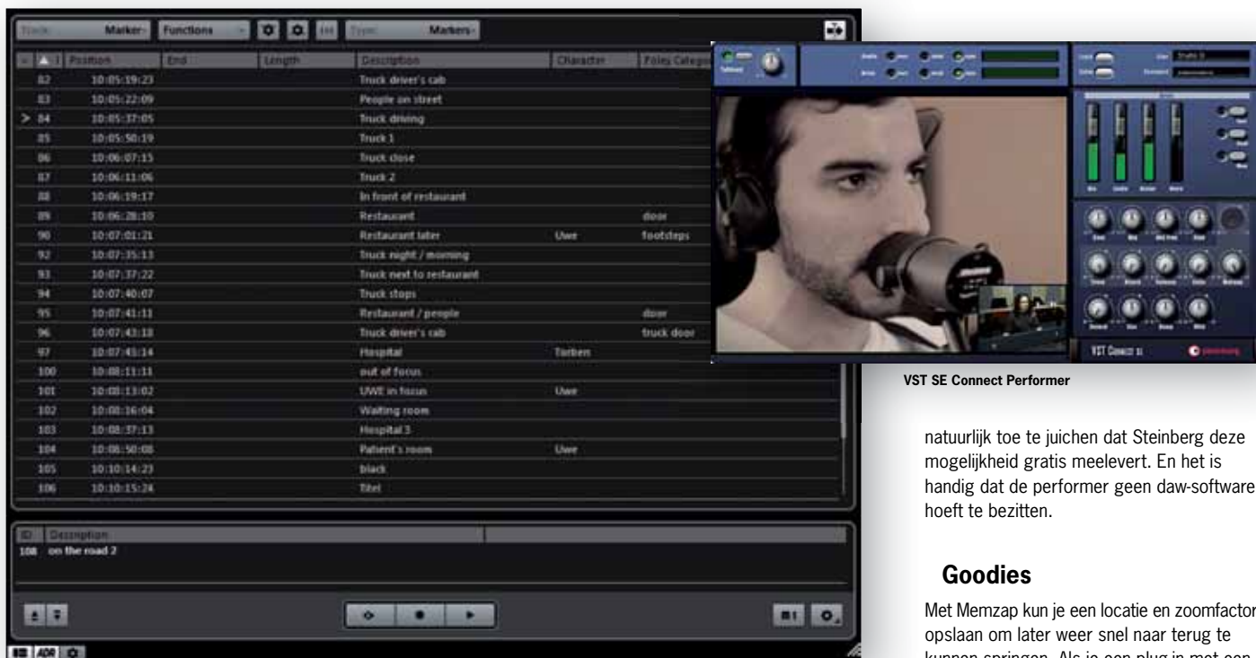
ADR Taker (Automated Dialogue Replacement)