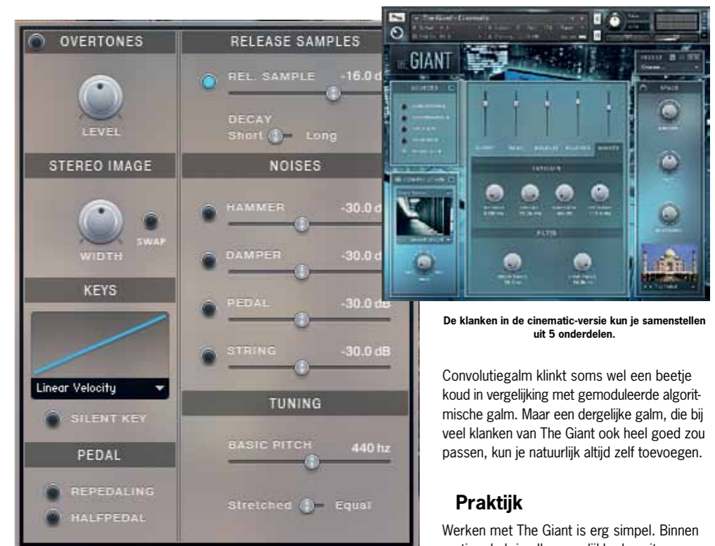
De klanken in de cinematic-versie kun je samenstellen uit 5 onderdelen.

gesampled concertvleugels van de concurrenten. Het sterke punt van The Giant als traditionele piano (de Day-versie) is de toepassing in pop- en rockproducties, maar ook voor materiaal van singer-songwriters, soundtracks en zelfs in jazzy muziek. Door de vele klankopties kan deze piano allerlei stijlen aan, maar je blijft altijd een strakke, directe piano horen met een krachtige, heldere aanslag die zich goed kan handhaven in de mix. Alle presets zijn op smaak gebracht met effecten, waarbij vaak de stevige compressie opvalt. Deze pianopresets kun je zo in een moderne volle productie gebruiken, zonder dat je zelf met de dynamiekprocessors in je daw aan de slag moet.