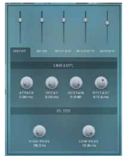
Elk van de vijf cinematic elements heeft een eigen envelope en low pass- en high pass-filter.

Naast de meegeleverde presets is er voor tweakers genoeg te beleven op de verschillende dashboards. Bij de Day-versie regel je in de Tone-sectie in drie delen de klankbalans over het klavier, de volumeverhouding tussen links en rechts en de compressor. In de Anatomy-sectie kun je de fysieke elementen van