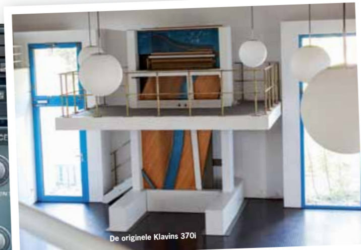
De originele Klavins 3701

gesampled concertvleugels van de concurrenten. Het sterke punt van The Giant als traditionele piano (de Day-versie) is de toepassing in pop- en rockproducties, maar ook voor materiaal van singer-songwriters, soundtracks en zelfs in jazzy muziek. Door de vele klankopties kan deze piano allerlei stijlen aan, maar je blijft altijd een strakke, directe piano horen met een krachtige, heldere aanslag die zich goed kan handhaven in de mix. Alle presets zijn op smaak gebracht met effecten, waarbij vaak de stevige compressie opvalt. Deze pianopresets kun je zo in een moderne volle productie gebruiken, zonder dat je zelf met de dynamiekprocessors in je daw aan de slag moet.