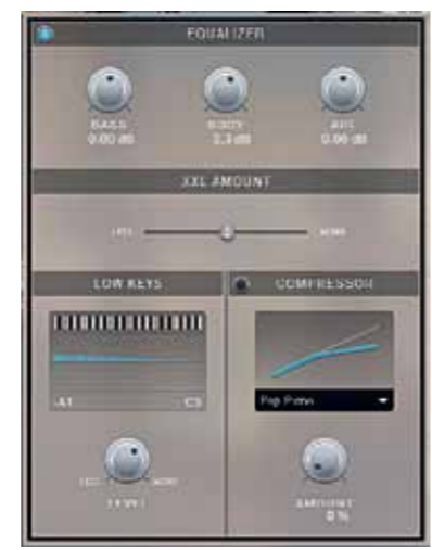
Op het Tone-panel kun je de lage tonen naar smaak accentueren.

Met zijn 190MB aan sampledata kun je hem natuurlijk niet vergelijken met de uitgebreid