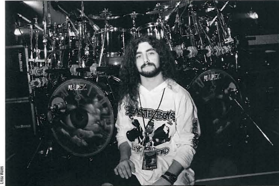
‘We zijn ook gewone mensen, die net zo graag naar Peter Gabriel of Sting luisteren als anderen.’

veel later ontdekte ik Rush en Neil Peart. Dat gooide mijn idee van wat drummen was aardig door de war. Ik hoorde dat ik niet altijd de snare op twee en vier hoefde te slaan en dat er ook zoiets bestond als oneven maatsorten. Nadat ik alle Rush-platen uit mijn hoofd had geleerd, werd ik er een stuk creatiever door, zeg maar... Tegelijkertijd begon ik met een coverband, waarmee ik alles speelde, van AC/DC tot Van Halen.’