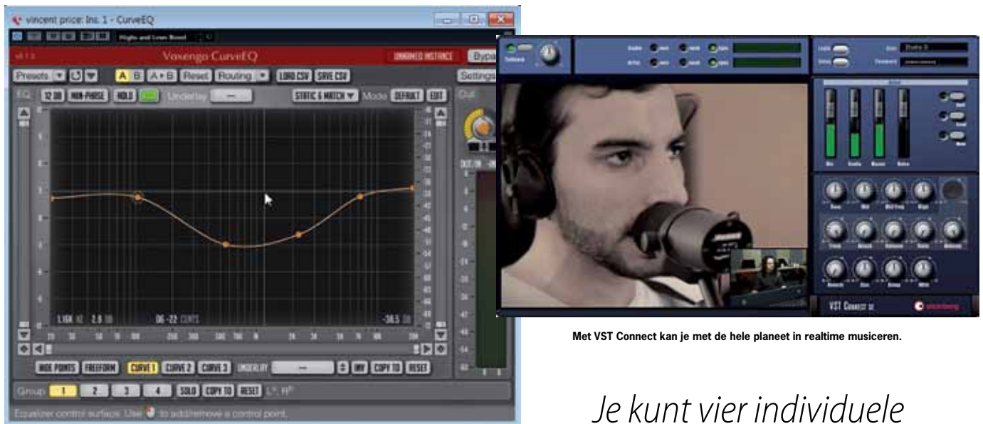
Voxengo CurveEQ past niet helemaal in de vormgeving van Cubase 7, maar voegt wel zeer nuttige functionaliteit toe.

Met VST Connect kan je met de hele planeet in realtime musiceren.