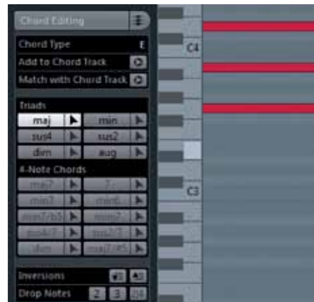
In de Key Editor kunnen ook akkoorden worden ingevoerd door middel van akkoordsymbolen.

envelope shaper, saturation en limiter die voor een deel zijn gebaseerd op plug-ins die al in Cubase zaten, maar die je nu makkelijker en sneller kunt inzetten. Er zijn ook nieuwe plug-ins, zoals de Tube Compressor. Ook kun je kiezen op welke plaats in deze keten de 4-bands eq van het channel wordt geplaatst. In de compressorsectie kun je kiezen uit Standard, Tube en Vintage, en de limiter kan een brickwall limiter zijn, een maximizer of een standaard model. De envelope shaper gaat aan de slag met de transiënten van je audio, waardoor je een drum-, percussie- of baspartij meer pit kunt geven, maar ook een agressieve klank kunt temmen. De modules in de channel strip kun je in willekeurige volgorde gebruiken en met drag & drop verplaatsen. Dat kan trouwens met alle plug-ins en effecten in de nieuwe Cubase MixConsole.