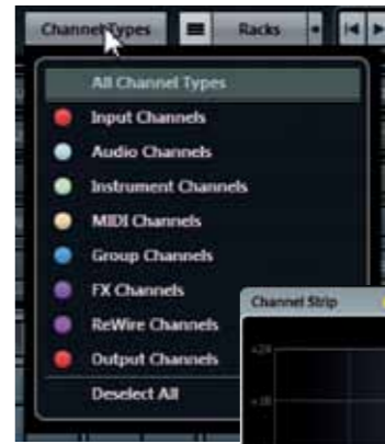
Je kiest nu niet meer met cryptische symbolen welke typen kanalen je wilt zien in de mixer.

Als je niet in het bezit bent van een Yamaha Nuage, Avid System 5-MC of Artist series, Mackie Control, Steinberg Houston of de WK Audio-ID, moet je wat verder in de instellingen onder Devices duiken en daar een nieuwe controller aanmaken vanuit de lijst met meegeleverde sjablonen. Als jouw controller daar ook niet bij zit, kun je via het Generic sjabloon