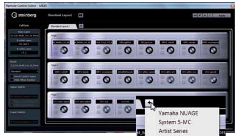
De nieuwe Remote Control Editor