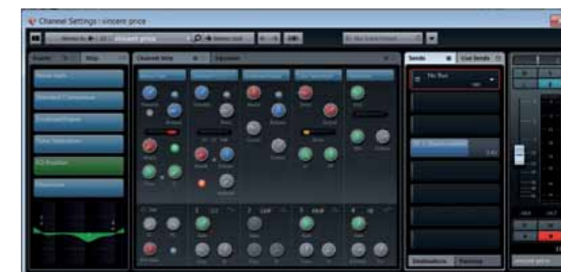
Ook in het Channel Window vind je de nieuwe MixConsole-lay-out terug.

De mixer is niet alleen flexibeler geworden, maar er is ook functionaliteit toegevoegd in de vorm van een channel strip voor elk kanaal. Hierin vind je een noise gate, compressor, >>