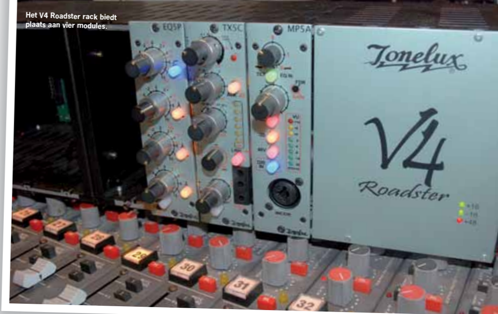
Het V4 Roadster rack biedt plaats aan vier modules.

De TX5C compressor biedt heel veel muzikale mogelijkheden met dezelfde muzikale zachte toon als de eq en de preamp