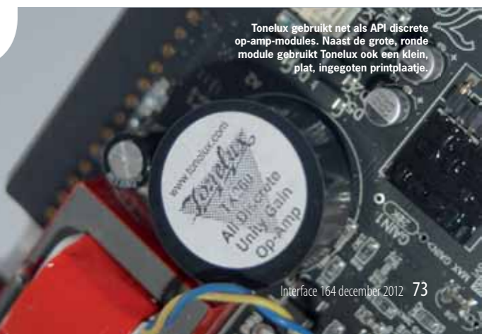
Tonelux gebruikt net als API discrete op-amp-modules. Naast de grote, ronde module gebruikt Tonelux ook een klein, plat, ingegoten printplaatje.

In nagenoeg elke Tonelux module zit een discrete op-amp en kenners zullen dan snel denken aan de op-amps van API. Er is echter geen zakelijke verbintenis tussen API en Tonelux, alhoewel Tonelux-oprichter Paul Wolff, voordat hij in 2004 Tonelux startte, wel eigenaar was van API. Met Tonelux is Wolff een nieuwe weg ingeslagen waarbij hij wil inspelen op de veranderde vraag vanuit de studio-wereld. Tonelux bouwt analoge modules die je los in een Tonelux rack kunt monteren maar ook kunt samenvoegen tot een custom built mengtafel van acht tot tachtig kanalen. De VRack-serie is het eigen modulaire racksysteem van Tonelux, maar de belangrijkste VRack modules zijn nu ook voor het Lunchbox-formaat verkrijgbaar.